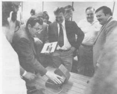
Above: MRDS system used by Vancouver police.